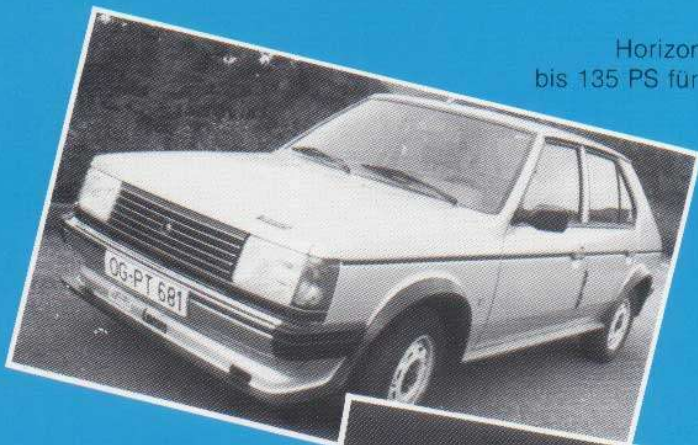
Horizon bis 135 PS für Straße